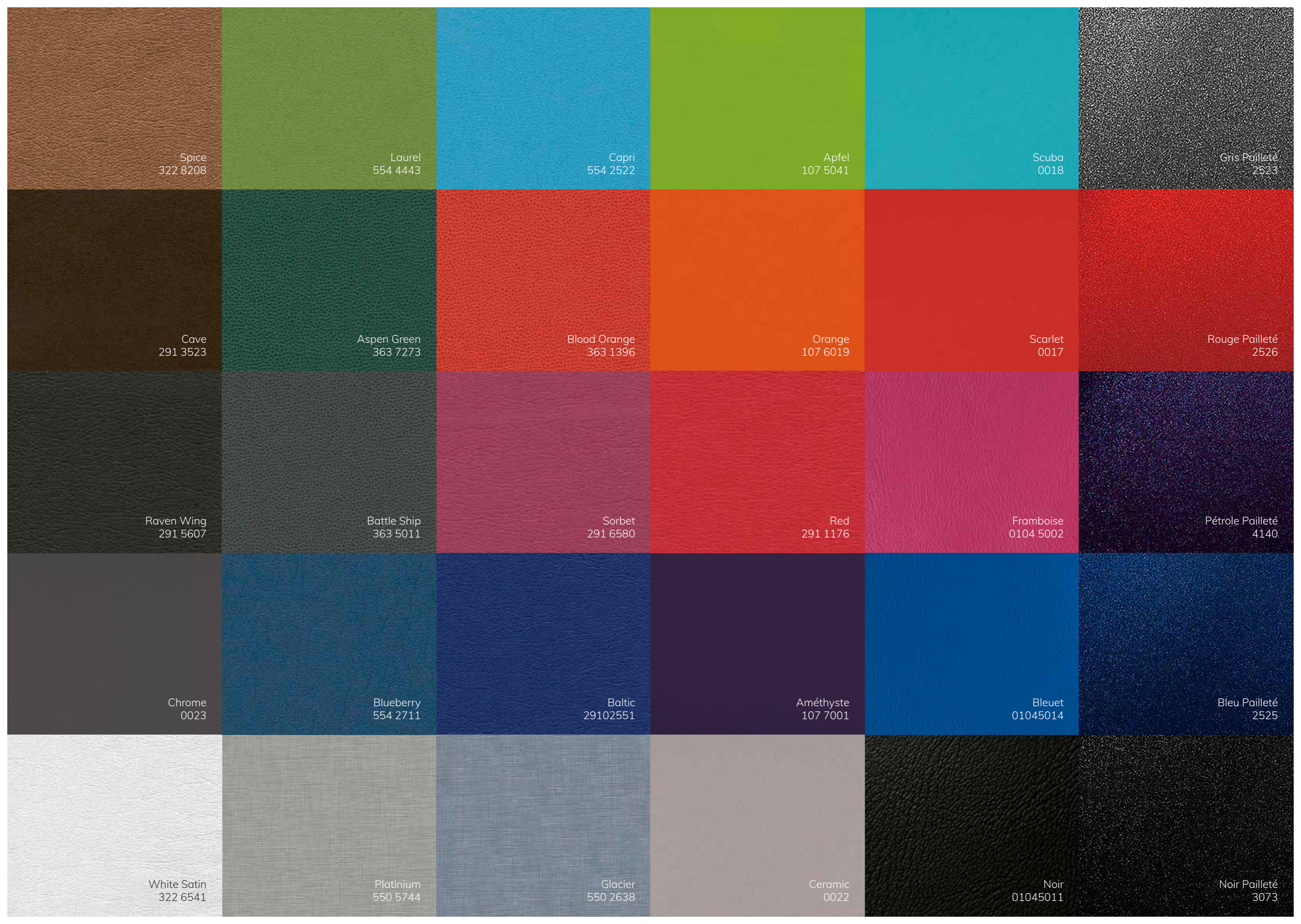
Spice 322 8208