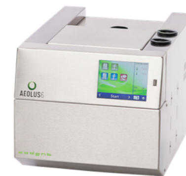
AEOLUS 6 ACIER INOXYDABLE BROSSÉ

Aeolus 6 permet de traiter 6 instruments en même temps, équipé d'une porte de fermeture électrique simple d'utilisation qui permet d'offrir des surfaces totalement lisses, exemptes de nervures qui pourraient générer un nid bactérien. Il devient facile à nettoyer pour plus d'hygiène et de durabilité.