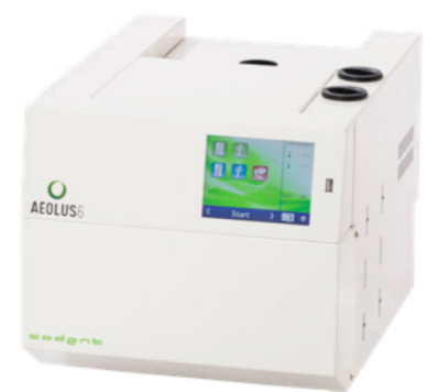
AEOLUS 6 BLANC