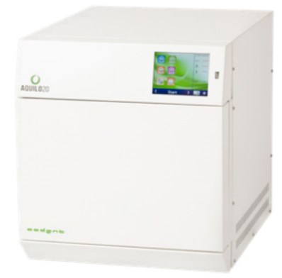
AQUILO 20 BLANC