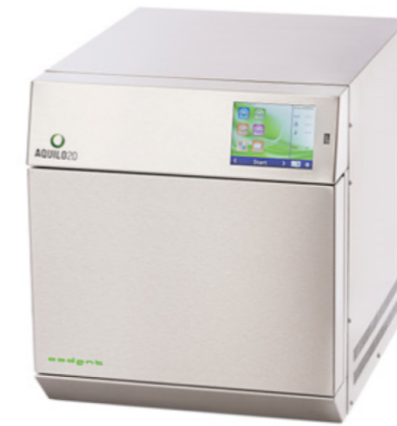
AQUILO 20 ACIER INOXYDABLE BROSSÉ

Dotée d'une porte électrique, facile à utiliser, elle permet d'offrir des surfaces totalement lisses, exemptes de nervures qui pourraient générer un nid bactérien. Il devient facile à nettoyer pour plus d'hygiène et de durabilité.