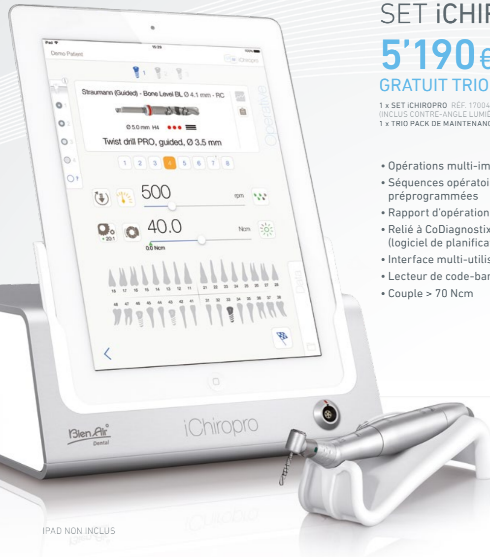
IPAD NON INCLUS

Offre : • 1 x console iChiropro • 1 x Contre-angle lumière CA 20:1 L Micro-series • 1 x micromoteur MX-i LED avec 3 ans de garantie* • 1 x câble MX-i LED • 1 x pédale • 10 x lignes d'irrigation • 2 x films de protection stériles pour iPad • 1 x Trio pack de maintenance RÉF. 1700440-001